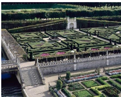
El jardín de Música del Castillo de Villandry (Indre-et-Loire)

Nuestro imaginario del jardín se ha venido construyendo desde la Edad Media, tomando como referente el jardín cerrado, que exhibe un espacio regular. Las abadías han contribuido en gran medida a la difusión de este estilo. El jardín adquiere entonces una carga simbólica que va más allá del uso simplemente alimentario y muchos elementos decorativos (como baldosas, una fuente central, o las vides, ya están presentes). El desarrollo del poder monárquico desde el inicio del siglo XV trae consigo una cierta estabilidad política; la valla usada como defensa se convierte a menudo en un elemento decorativo. Con la nueva arquitectura de los castillos y el acceso directo al jardín, la escala del jardín