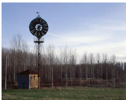
Turbina de viento en Bollée del castillo de Mazères à Azay-le-Rideau (Indre-et-Loire)

En los jardines, el agua es omnipresente. A diferencia de lo vegetal, es maleable y fluida. Cumple con una función de ornamentación y riego. Desde el Renacimiento hasta el Barroco, el agua puede ser espectacular gracias a las fuentes, cascadas artificiales y chorros de agua que impresionan a los espectadores. Pero también puede ser tranquila en los calmados espejos de agua del jardín francés que hacen eco de los parterres de flores bien ordenados. A estas impresionantes puestas en escena, el