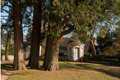
Fábrica en los jardines del Obispo de Blois (Loir-et-Cher)

Durante el Renacimiento el jardín se abre manteniendo una arquitectura vegetal que preserva la intimidad de los caminantes. Bajo la influencia de Italia, las pérgolas cubiertas de plantas trepadoras, los gabinetes de verdor, los laberintos, las cuevas y jardines secretos evocan la organización del palacio celebrando la alianza del hombre con la naturaleza. El jardín está habitado, como un museo al aire libre, por antiguas estatuas que siguen un programa iconográfico deliberado.