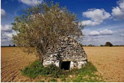
Loge de vigne à Châteauneuf-sur-Cher (Cher) Cl. Hubert Bouvet, 2007