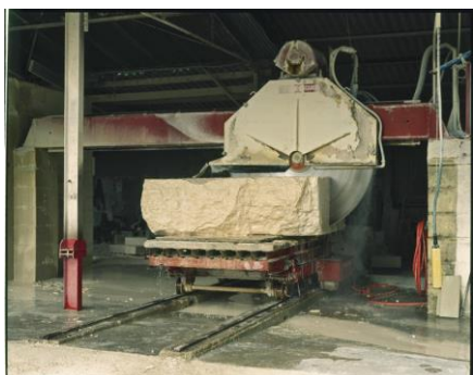
Débitage d'un bloc de calcaire dans une carrière de Saint-Aigny (Indre)