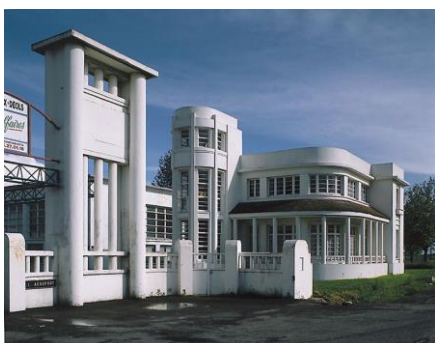
Entrée principale de l'ancienne usine d'aviation Marcel Bloch à Déols (Indre) Cl. Mariusz Hermanowicz, 2004