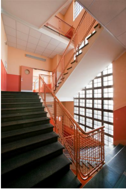
Escalier à l'intérieur du collège de Châteauneuf-sur-Loire (Loiret).