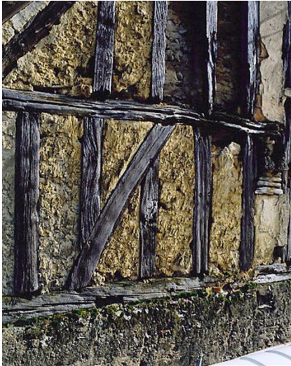
Hourdis d'une maison d'Aubigny-sur-Nère (Cher) Cl. Jean-Claude Jacques, 1985