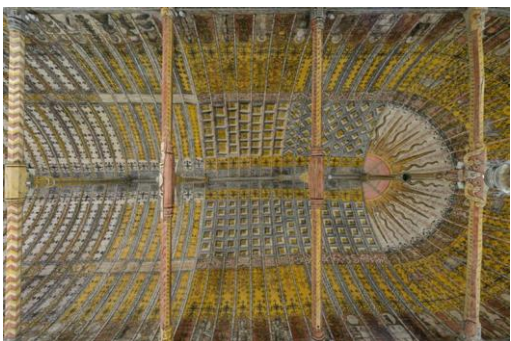
Voûte peinte de l'église de La Croix-du-Perche (Eure-et-Loir) Cl. François Lauginie, 2014