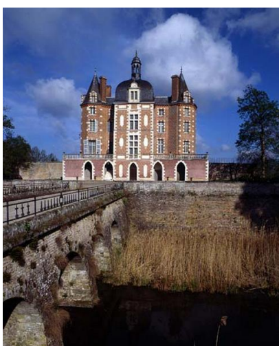
Château de La Ferté-Imbault (Loir-et-Cher) Cl. Jean-Claude Jacques, 1989