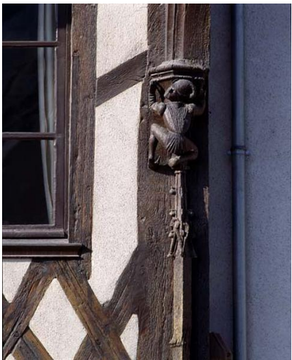
Personnage sculpté sur un pan de bois, maison des Acrobates à Blois (Loir-et-Cher) Cl. Mariusz Hermanowicz, 1991