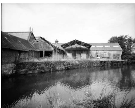
Bâtiment du haut-fourneau de la forge de Fréteval (Loir-et-Cher) Cl. Mariusz Hermanowicz, 2000