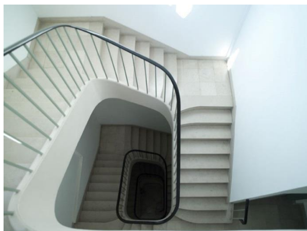
Vue plongeante sur l'escalier principal de l'aile est de l'école des beaux-arts. 2010.