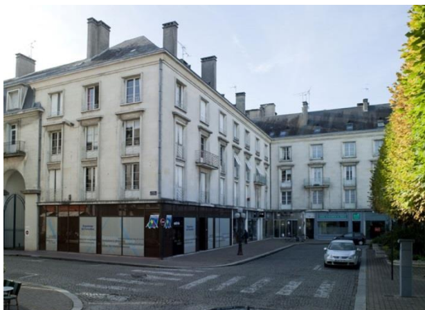
Façades de l'îlot M donnant sur la place de la Résistance. 2010.

Les vestiges du Tours historique sont précieusement conservés ou restaurés. Les grands groupes d'immeubles offrent des façades en pierre de taille ou parement rappelant la blancheur du tuffeau et toutes les toitures sont en ardoise. La hauteur des îlots faisant face aux parties du centre historique non détruites est limitée afin de garder une certaine harmonie.