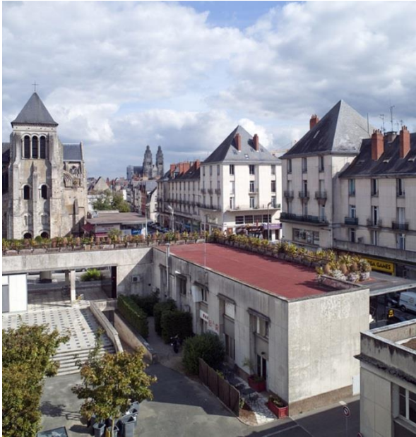
Magasin-terrasse vu depuis l'école des beaux-arts. 2014.

d'inventaire de la Région Centre-Val de Loire. En 12 panneaux et 52 photos, le public pourra resituer le contexte historique et les enjeux sociaux des réalisations de la Reconstruction tourangelle. Après avoir déchiffré l'architecture, il poussera les portes des immeubles et admirera des intérieurs pensés pour être élégants et fonctionnels.