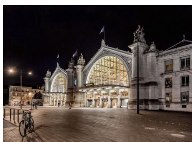
Gare de Tours.

SNCF Gares & Connexions est née d'une conviction : les gares sont des lieux de vie à part entière, à la croisée des parcours. Poumons des villes, les gares métamorphosent les territoires et facilitent le quotidien de chacun. Accueillir chaque jour 10 millions de voyageurs, visiteurs et riverains appelle un engagement fort pour améliorer toujours la qualité de l'exploitation, imaginer de nouveaux services et moderniser le patrimoine.