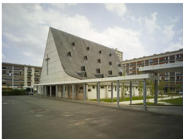
Vue d'ensemble du Centre paroissial Saint-Paul, quartier du Sanitas. 2011.