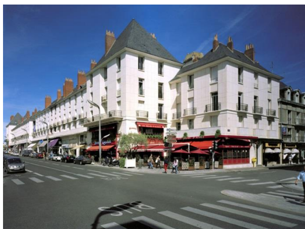
Façades ordonnancées des îlots H et G, rue Nationale. 2010.