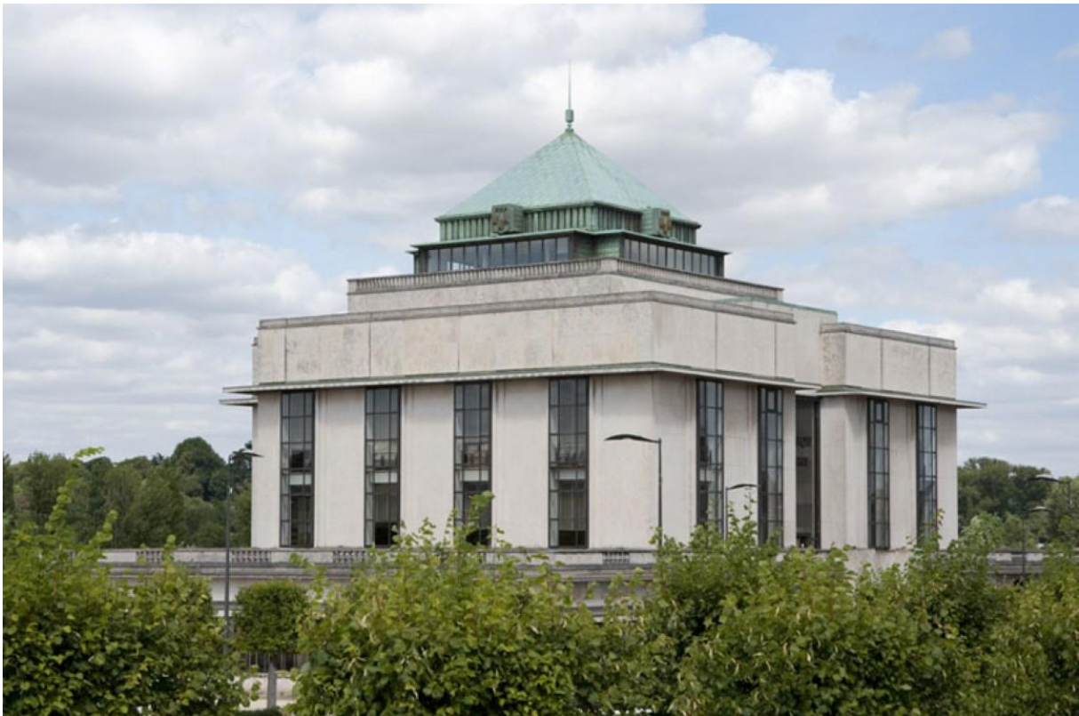
Le toit en pavillon de la bibliothèque municipale. 2010.

Malgré l'effort de construction pour reloger les sinistrés, la crise du logement est encore manifeste à Tours et les années 1950 marquent les débuts de la construction du logement de masse. De 1958 à 1971, l'édification du Sanitas offre le confort moderne à de très nombreuses familles tout en expérimentant de nouvelles techniques de construction.