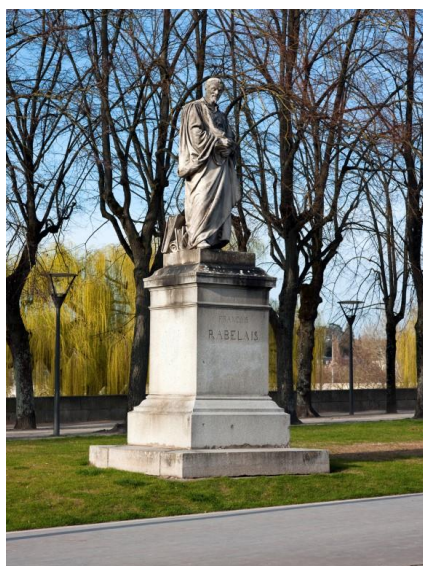
Henri Dumaige, monument à Rabelais, marbre sur socle de pierre, 1880, Tours (Indre-et-Loire).

Le service Patrimoine et Inventaire de la Région Centre-Val de Loire a étudié, de 2010 à 2013, 186 monuments et 25 fontaines érigés entre 1800 et 1945 et publié en 2015 une synthèse de cette étude régionale. La présente exposition porte sur les monuments élevés à la mémoire des grands hommes, qui constituent plus de 120 monuments.