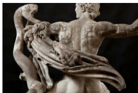
Cadmus combattant le serpent de la source de Dircé, par Louis-Marie Dupaty, 1822, Musée des Beaux-arts d'Orléans (Loiret), [ancien emplacement : Jardin des Plantes d'Orléans]