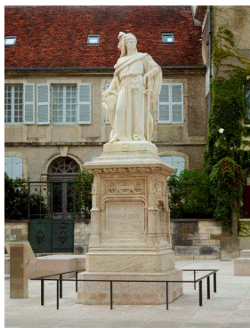
Jacques Cœur, par Auguste Préault, 1873-1875, marbre, Bourges (Cher)