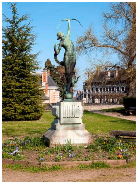
Statue de Diane, par Anna Hyatt-Huntington, 1934, Blois (Loir-et-Cher)