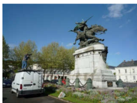
Le photographe de la DIP en action, Statue de Jeanne d'Arc, Chinon (Indre-et-Loire) ©Région Centre, Inventaire général

Cliché F. Laugnie, 2012©Région Centre, Inventaire général IVR24_20124500070NUC2A_P