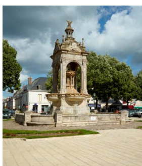
Fontaine Gaullier, Place du 18 octobre, 1860, Châteaudun (Eure-et-Loir)