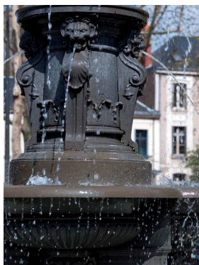
Fontaine de la place d'Entraigues, modèle de la Fonderie Ducel, Tours (Indre-et-Loire) IVR24_20123700994NUC4A_P