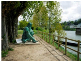
Statue de Léonard de Vinci, par Amleto Cataldi, vers 1920, Amboise (Indre-et-Loire)