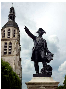
Général Rochambeau , par Fernand Hamar, Vendôme (Loir-et-Cher)