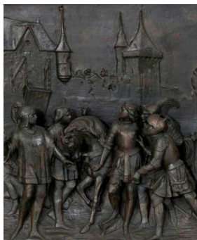
Jeanne blessée devant Paris , détail d'un bas-relief du monument Jeanne d'Arc à Orléans, par Vital-Dubray, Musée des Beaux-arts d'Orléans (Loiret)

Cliché T. Cantalupo, 2012©Région Centre, Inventaire général IVR24_20124100813NUC4A_P