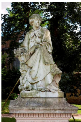
Statue de George Sand, 1884, La Châtre (Indre)