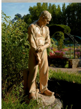
Le grand paysan, par Jules Dalou, en grès de la manufacture de Sèvres, Jardin des Prés-Fichaux, Bourges (Cher)